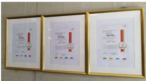
Zufriedenheits-Label der terzStiftung von 2025 bis 2027

Wichtig ist natürlich, dass wir in dieser Nachbefragung in allen drei Gruppen das Zufriedenheits-Label der terzStiftung erhalten haben.